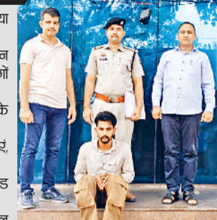
नारनौल। पुलिस गिरफ्तार में आरोपित।