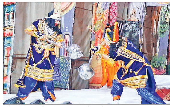
मंडी अटेली। रामलीला में युद्ध करते बाली-सुग्रीव।