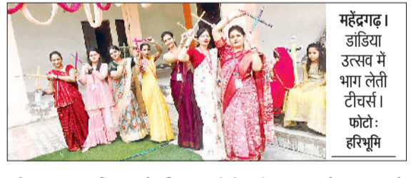
महेन्द्रगढ़। डांडिया उत्सव में भाग लेती टीचर्स।