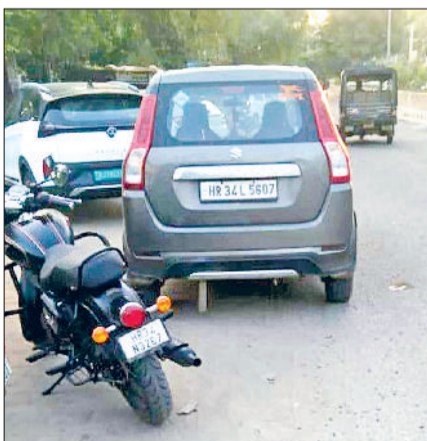
महेंद्रगढ़। बाजार में सड़क पर खड़े वाहन।

नपा की ओर से शहर बालाजी चौक नगर पालिका कार्यालय के सामने पुराने किले के पीछे, भगवान परशुराम चौक पर बड़ा बाजार, चौधरी रणबीर सिंह हुड्डा पार्क के पास खाली जगह, ओटो मार्केट के पीछे आदि स्थानों पर पार्किंग बनाने का विचार किया गया था। इसके लिए नपा की हर बैठक में प्रस्ताव पास किया जा चुका है, लेकिन जिम्मेदार अभी तक धरातल पर नहीं उतर पाए हैं।