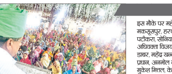
नारनौल। कार्यकर्ताओं को संबोधित करते डा. अजय चौटाला।

जननायक जनता पार्टी मजबूत कार्यकर्ताओं की फौज है। भाजपा सरकार की खराब नीतियों से प्रदेश का आमजन परेशान है। जनहित में प्रदेश में बदलाव लाने के लिए जेजेपी का एक-एक मेहनती कार्यकर्ता अभी से संघर्ष में जुट जाए तथा जननायक जनता पार्टी का कार्यकर्ताओं का संघर्ष ही आने वाले समय में जाकर परिवर्तन लेकर आएगा। यह बात पर प्रदेश के राष्ट्रीय अध्यक्ष डॉ. अजय सिंह चौटाला मंगलवार को पार्टी के पदाधिकारी और कार्यकर्ताओं की बैठक को संबोधित करते हुए कही। अजय सिंह चौटाला ने कहा कि भाजपा सरकार किसानों की कमर तोड़ने का काम कर रही है। सरकार के पास किसानों को राहत पहुंचाने की कोई योजना नहीं है। अब