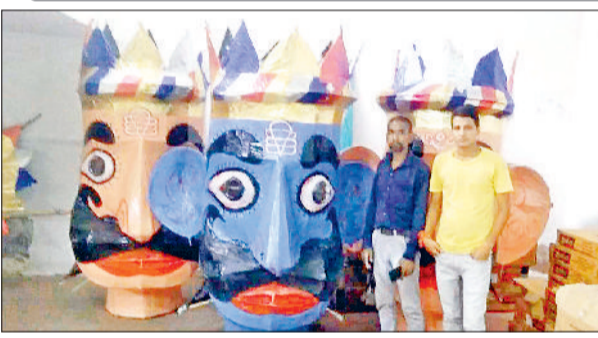
महेंद्रगढ़। श्री आदर्श रामलीला में बनकर तैयार खड़े पुतले।

श्री आदर्श रामलीला कमेटी व श्री हनुमान रामलीला कमेटी की ओर से शोभायात्रा के दौरान करीब एक लाख 10 हजार रुपये की लागत से आतिशबाजी की जाएगी। वहीं रामलीला परिषद की ओर से पर्यावरण को ध्यान में रखते हुए आतिशबाजी नहीं की जाएगी।