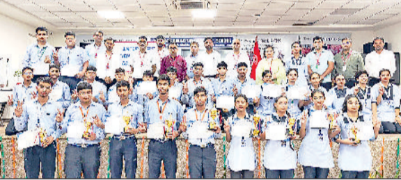
महेन्द्रगढ़। प्रतियोगिता के विजेता विद्यार्थी।