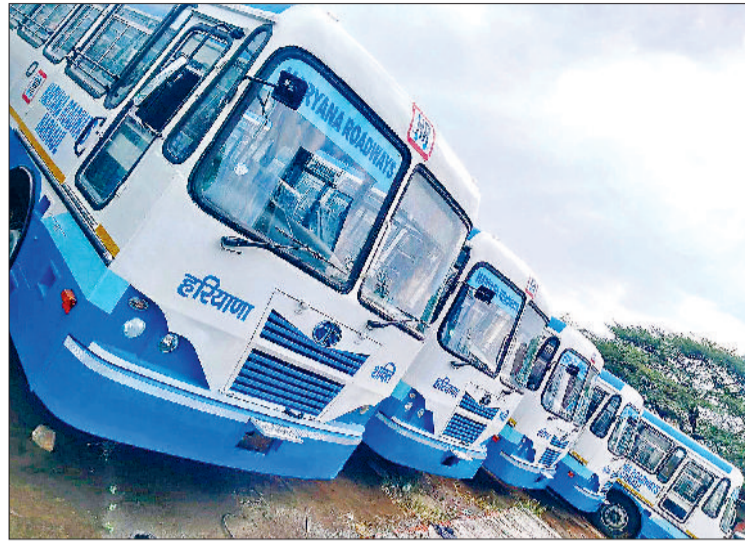
नारनौल। बेड़े में शामिल हुईं नई रोडवेज बसें।

नौर हो कि रोडवेज बस डिपो नारनौल लगभग तीन दशक पुराना है। इस बस डिपो के अधीन जिलेभर के ग्रामीण रूटों के अलावा विभिन्न लंबे रूटों पर भी बसें का संचालन किया जाता रहा है। वर्तमान में हालात ऐसे बने हुए हैं कि आबादी बढ़ने के अनुपात में रोडवेज बसें में वृद्धि नहीं हुई। इस कारण जिले में कई रूट ऐसे भी हैं, जहां बसें की डिमांड है, लेकिन पर्याप्त रोडवेज बसें नहीं होने के कारण वहां पर बसें नहीं चलाई जा रही। बसें की कमी के कारण आज भी नारनौल-कनीना रूट पर सर्वाधिक एस्टीमेट परमित वाली बसें चल रही हैं। कनीना ही नहीं, महेंद्रगढ़-दादरी रूट का भी यही हाल है, जहां प्राइवेट बसें दिनभर नारनौल से दादरी के बीच दौड़ती रहती हैं। हालांकि वर्तमान में नारनौल डिपो से लगभग 148 रोडवेज बसें का संचालन किया जा रहा है, लेकिन इनमें से करीब पांच-सात बसें तो वर्कशॉप में रिपेयर के लिए ही खड़ी रहती हैं, जबकि नारनौल-दिल्ली रूट पर सर्वाधिक बसें का संचालन किया जा रहा है। जयपुर, झुंझुनू एवं अलवर रूट पर भी काफी बसें चलती हैं, लेकिन लोकल रूटों पर बसें की भारी कमी बनी हुई है। हालांकि अब 25 नई रोडवेज बसें मिलने से कुछ राहत मिलने की पूरी संभावना नजर आ रही है।