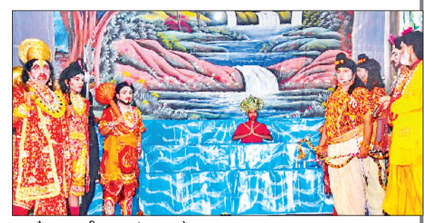
नारनौल। रामलीला का मंचन करते कलाकार।