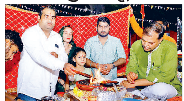
नारनौल। मां काली का पूजन करते कलाकार।