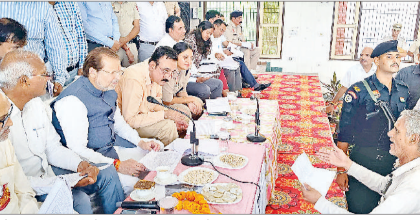
कनीना। बैठक में नागरिकों की शिकायतें सुनते सहकारिता मंत्री।

सहकारिता मंत्री मंगलवार को महिला महाविद्यालय उन्हाणी में जिला लोक संपर्क एवं जन परिवेदना समिति की मासिक बैठक के बाद पत्रकारों से बातचीत कर रहे थे। इससे पहले उन्होंने पहले से ही निर्धारित 12 मामलों की सुनवाई की। जिनमें से छह शिकायतों को मौके पर निपटारा किया गया। बारिश के चलते छह शिकायतकर्ता हाजिर नहीं हो सके। उनके परिवार आगली बैठक में निपटारे जाएंगे। इसके अलावा भी अन्य नागरिकों की भी शिकायत सुन उनका मौके पर ही निदान किया।